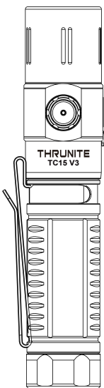
TC15 V3 User Manual